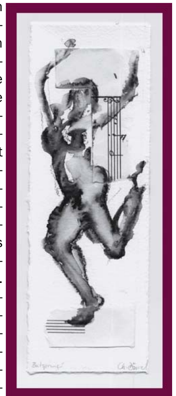
Titel: Zeitsprung 1

für ein kulturelles Miteinander in unserer Gesellschaft vorgesehen ist. Ihre Ausführungen decken sich mit meinen persönlichen Erfahrungen als Künstlerin. In ei-