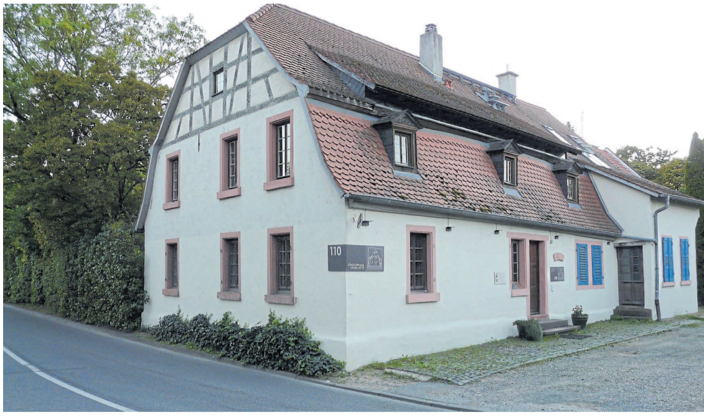
Da ist kein Platz mehr für einen Bürgersteig: Das „Künstlerhaus Ziegelhütte“ war das Kontorgebäude einer Ziegelei und stand vor vierzig Jahren kurz vor dem Abriss. Ein Verein rettete das historische Bauwerk. Es wurde sparsam, aber zweckmäßig und originell renoviert. Hinter dem Haus liegt ein großes Freigelände für Skulpturen-Ausstellungen.