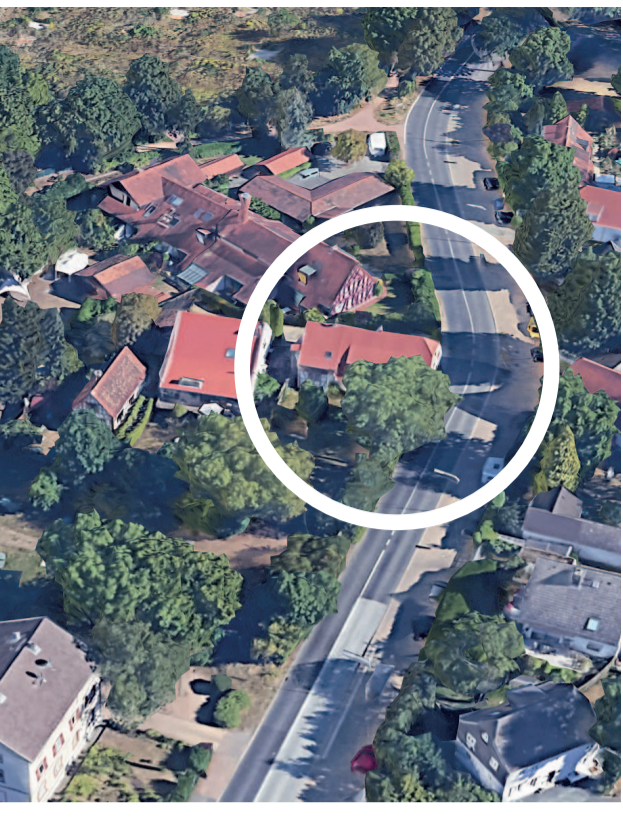
Hinter dem mit dem weißen Kreis markierten Künstlerhaus erstrecken sich die Gebäude der ehemaligen Ziegelei.