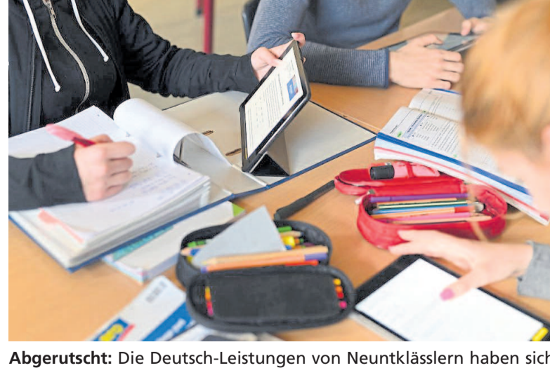
Abgerutscht: Die Deutsch-Leistungen von Neuntklässlern haben sich verschlechtert.

Die Studienautoren vom Institut zur Qualitätsentwicklung im Bildungswesen (IQB) nennen die Entwicklung „in hohem Maße besorgniserregend“. Mehr als 30.000 Neuntklässler an mehr als 1500 Schulen im Land mussten in der vorliegenden Testserie Aufgaben in Deutsch und Englisch lösen – in einigen Bundesländern auch Französisch.